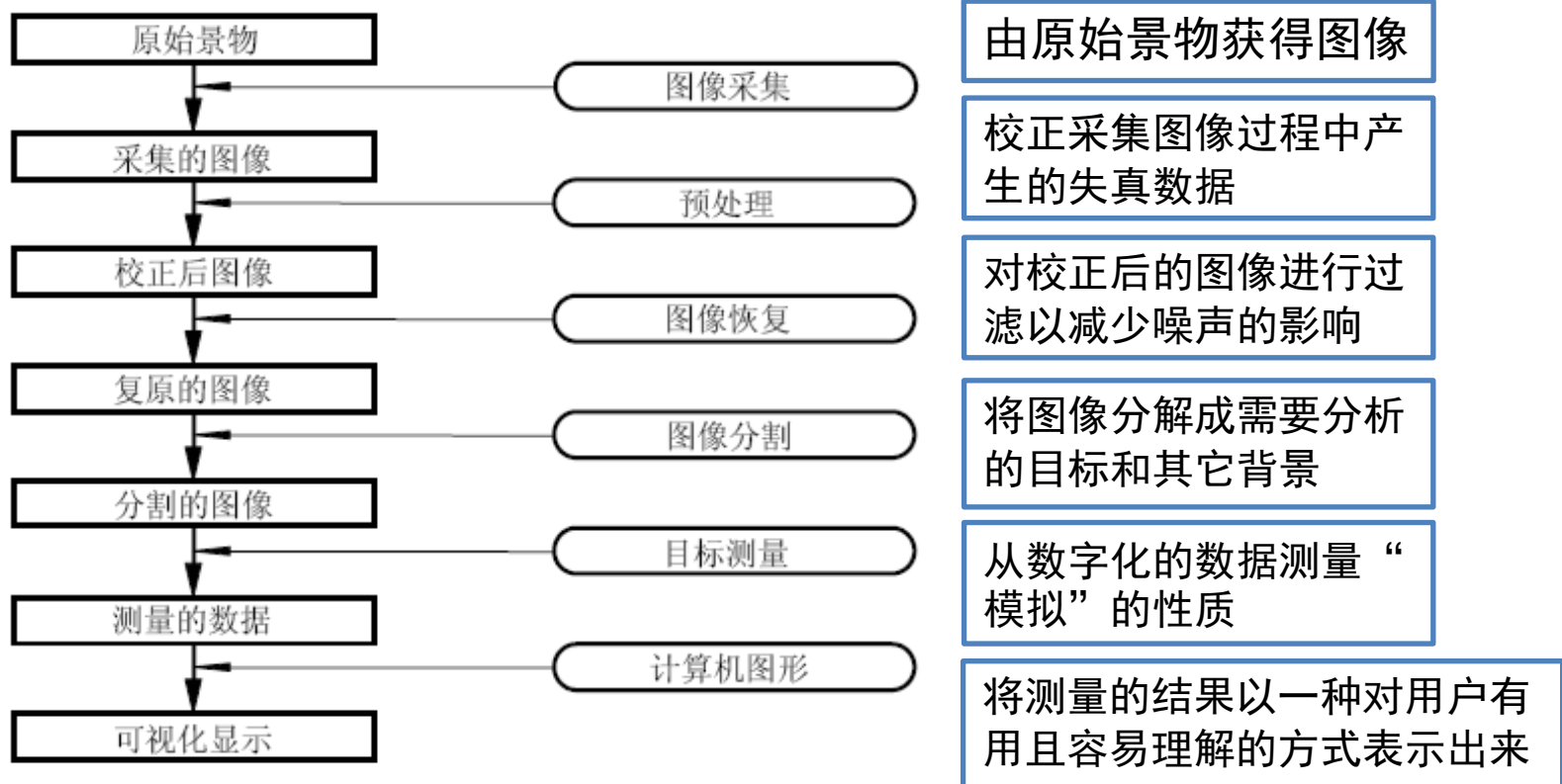
图 1.2.1 一个包含多个步骤的图像分析流程图